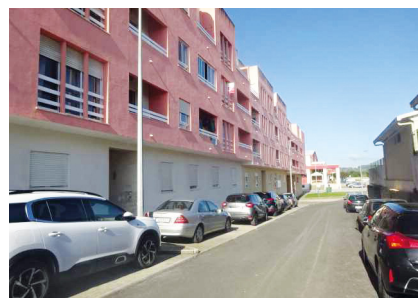
10. BOMBARRAL Rua Júlio César Machado, n.º 29, 2º Dto

Fração de tipologia T5, composta por hall de entrada e corredor, sala de estar, cozinha, 5 quartos, 3 casas de banho e varandas. Habitação com 142 m 2 , varandas com 22 m 2 e arrecadação de 14,51 m 2 . Localizado numa zona central e consolidada da cidade. O local beneficia de bons acessos rodoviários. Zona bem servida de transportes públicos.