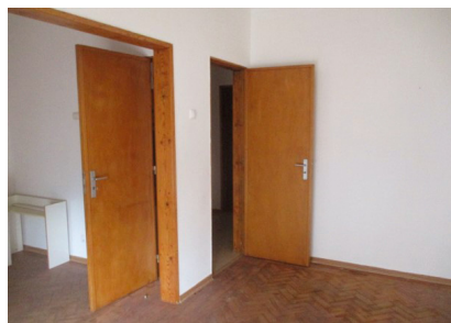
APARTAMENTO T2 73 m 2 valor v.: 120 000,00 €

Apartamento de tipologia T2, composto por hall, sala, cozinha, despensa, 2 quartos, 1 casa de banho e 2 varandas. Área da habitação 73m 2 e das varandas 8 m 2 . Localizado na zona ribeirinha e central da cidade do Montijo, de habitação e com comércio e serviços. O local beneficia de bons acessos rodoviários e de transportes públicos (autocarros).