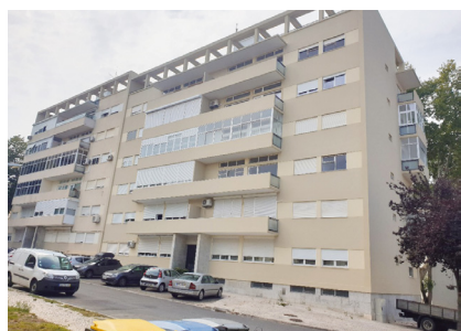
9. OLIVAIS Rua Cidade Lobito, nº 273, 5º Esq.

Fração T5, composta por hall de entrada e corredor, sala de estar, cozinha, 5 quartos, 3 casas de banho e varandas. Habitação com 142 m 2 , varandas com 22 m 2 e arrecadação de 14,51 m 2 . Localizado numa zona central e consolidada da cidade, na envolvente com imóveis para habitação, comércio e serviços. O local beneficia de bons acessos rodoviários. Zona bem servida de transportes públicos.