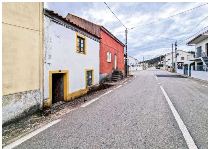
7. V. V. RÓDÃO Rua de Santo António, n.º 43, Alfrividia, Perais