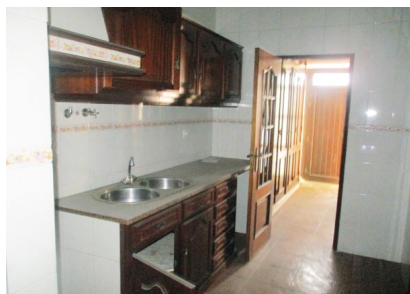
MORADIA T1 33 m 2 valor v.: 71 300,00 €

Morada geminada, de tipologia T1, composto por hall, sala, cozinha, 1 quarto, 1 casa de banho e logradouro. Área da habitação 33 m 2 e do logradouro 21 m 2 . Localizado numa zona onde predominam as moradias unifamiliares, com 1 a 2 pisos e edifícios multifamiliares com cerca de 4 pisos, com proximidade à zona de escolas, zona bem servida de comércio, bons transportes públicos.