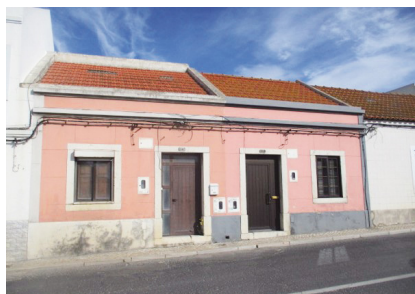
1. MOITA Rua de São Sebastião, n.º 61