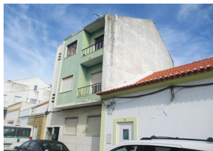
2. MONTIJO Rua Humberto de Sousa, n.º 14, 1º

Morada geminada, de tipologia T1, composto por hall, sala, cozinha, 1 quarto, 1 casa de banho e logradouro. Área da habitação 33 m 2 e do logradouro 21 m 2 . Localizado numa zona onde predominam as moradias unifamiliares, com 1 a 2 pisos e edifícios multifamiliares com cerca de 4 pisos, com proximidade à zona de escolas, zona bem servida de comércio, bons transportes públicos.