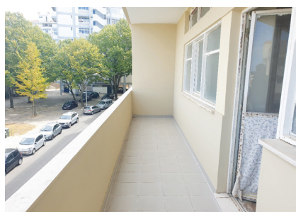
8. OLIVAIS Rua Cidade Lobito, nº 273, 2º Esq.

Morada em banda, com 2 pisos, com obra de remodelação inacabada. Composta por corredor, sala, quarto, cozinha, instalação sanitária na área dependente e 1º andar amplo. Habitação com 58 m 2 , anexo com 28 m 2 , sótão com 58 m 2 e logradouro com 140 m 2 . Imóvel localizado a 19 Km de Castelo Branco e Vila Velha de Rodão, acessos razoáveis e próximo da margem do Rio Ponsul.